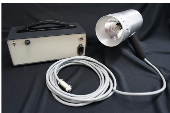
水銀ランプスペクトル